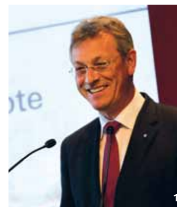
1 Staatskanzlei-Chef Siegfried Schneider würdigte die Leistungen der Bayerischen Landeszentrale für neue Medien beim Festakt im Münchner Literaturhaus.

Innovationsförderung und Qualitätssicherung als Kernaufgaben. Mit einer Diskussion über »Medienaufsicht in der digitalen Welt« im Münchner Literaturhaus feierte die Bayerische Landeszentrale für neue Medien (BLM) am 6. Mai ihr 25-jähriges Bestehen. TEXT Sandra Eschenbach