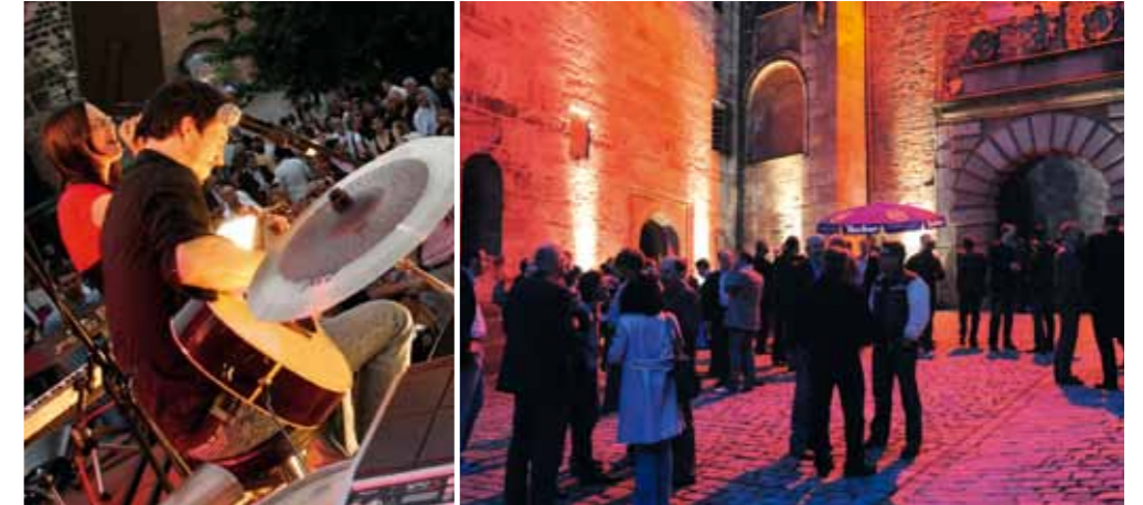
Das Medienfest auf der Kaiserburg wird wieder ein Highlight der Lokalrundfunktage werden.